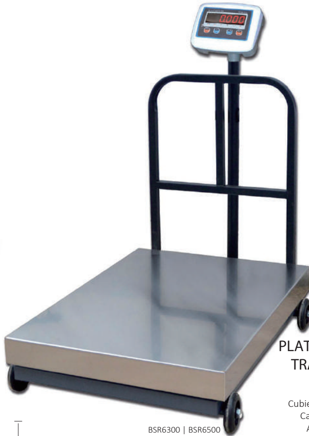
BSR6300 | BSR6500