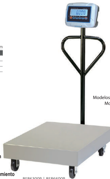
BSR6300P | BSR6600P