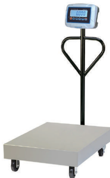
BSR6300P | BSR6600P