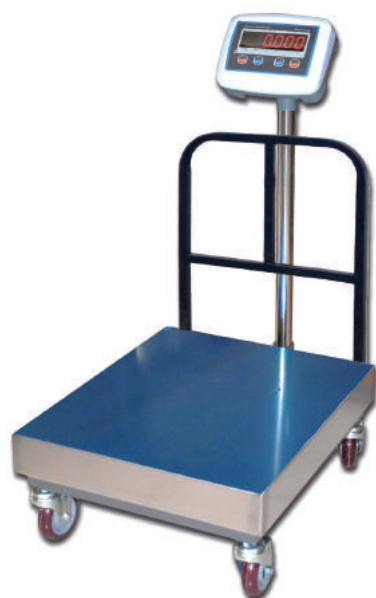
BSR5150 | BSR5300