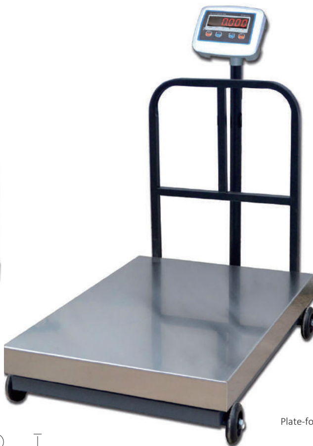
BSR6300 | BSR6500